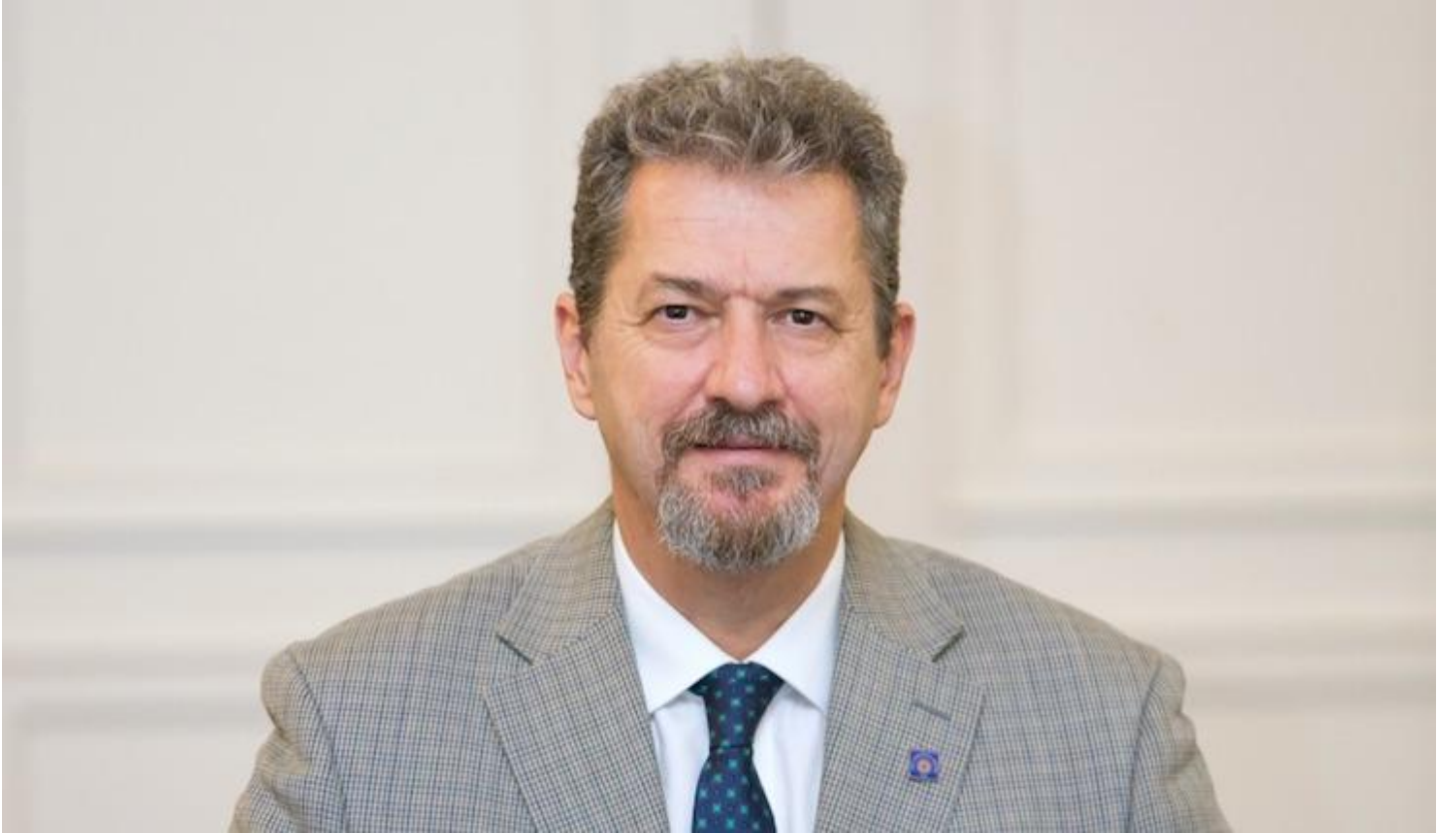
Prof. Dr. Hayri Özsan / Türk Hematoloji Derneği Başkanı

kan nakli olmadan hayatını devam ettiremeyecek hastalarımızın zor günler geçirmesine neden olmaktadır. Düzenli kan bağıışı sayesinde kan ürünlerinin kesintisiz olarak temini kanser ve kalıtsal kan hastalıklarına sahip erişkin ve çocuk hastalar için hayati önem taşımaktadır. Bu kampanyayı, diğer kan bağıışı kampanyalarından ayıran en önemli nokta, kanser ve kalıtsal kan hastalıklarına sahip kişiler için sıklıkla kan nakline ihtiyaç duyulduğunun vurgulanması ve bu konuda bir farkındalık yaratması olmuştur. Ayrıca bağıışların azaldığı dönemde yapılan kampanyanın, hastalar ve hasta yakınlarının umudunu artırması amaçlanmıştır. Özellikle koronavirüs nedeniyle kan bağıışının azaldığı bugünlerde, hijyenik koşullara sahip Türk Kızılay Kan Bağıışı Merkezleri'nin yeni bağıışçılarını beklediğini tekrar hatırlatıyoruz. Çünkü 1 kişi kan verir, 1000'lerce kişiye umut olur.